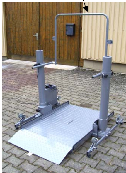
Sicherungsbügel hochklappbar, höhenverstellbar